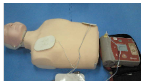
○応急手当コーナー

今回ご紹介した体験コーナーは一部になります。ご家族連れや企業、学校関係者の方々もご参加されています。是非体験してみてください。