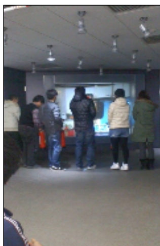
○消火体験コーナー