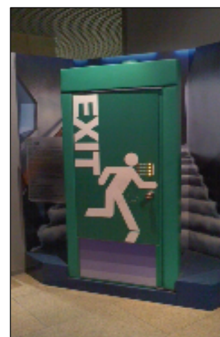
○浸水扉体験コーナー